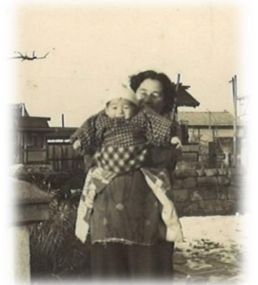
住職が誕生頃の写真で、唯一現存しているものです。1955年